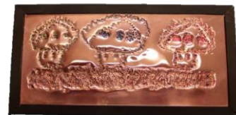
彫金工作風景と作品