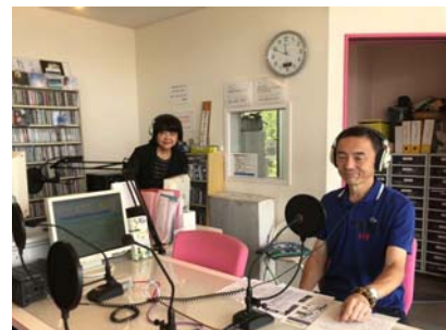
9/24 FM戸塚(東戸塚モレラ)