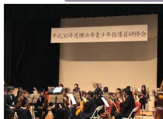
9/9 市青少年指導員研修会